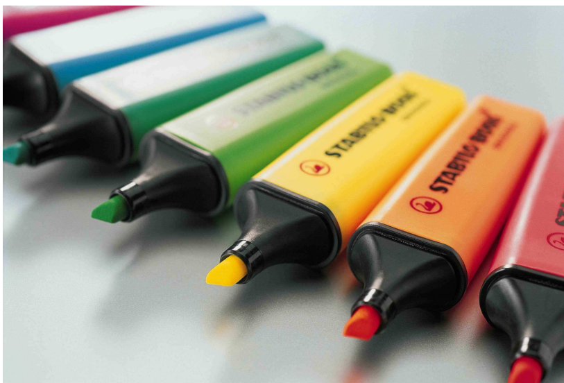
Den STABILO BOSS gibt es seit nunmehr 40 Jahren - hergestellt wird er in Weißenburg

Anfangs sollten in Weißenburg Füller und Füllerteile gefertigt werden, um mit der Marke URANIA den Füllermarkt zu bereichern. Doch Mitte der 1960er Jahre verlegte man den Schwerpunkt auf die zeitgemäßere Produktion von Kunststoffspritzgussteilen für Schreibstifte.